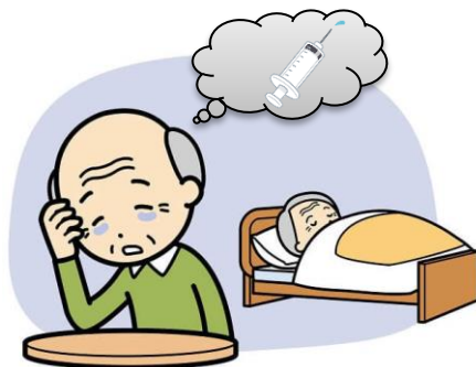
高齢者の介護負担とインフルエンザワクチン接種の関係

お問合せ先：新潟大学大学院医歯学総合研究科 助教 齋藤孔良 anayoshi@med.niigata-u.ac.jp